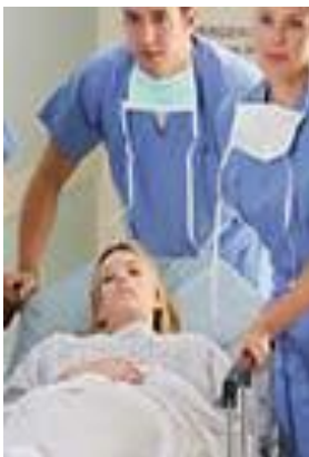
شکل ۳: در صورت تشخیص حاملگی خارج رحمی در بیمار عمل جراحی انجام می شود.

* درمان طبی در موارد خاص، با دارو و کنترل دقیق علائم بالینی و حیاتی، در بیمارستان قابل انجام است.