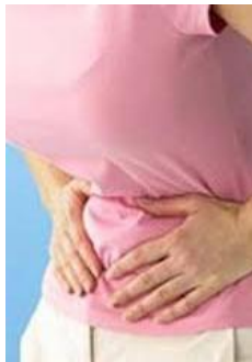
شکل ۲: درد شکم که رایج ترین شکایت پس از بروز حاملگی خارج رحمی است.

رایج ترین شکایت حاملگی خارج رحمی درد شکمی است شدت درد متغیر است و ممکن است یک طرفه یا دوطرفه، در قسمت تحتانی شکم احساس شود.